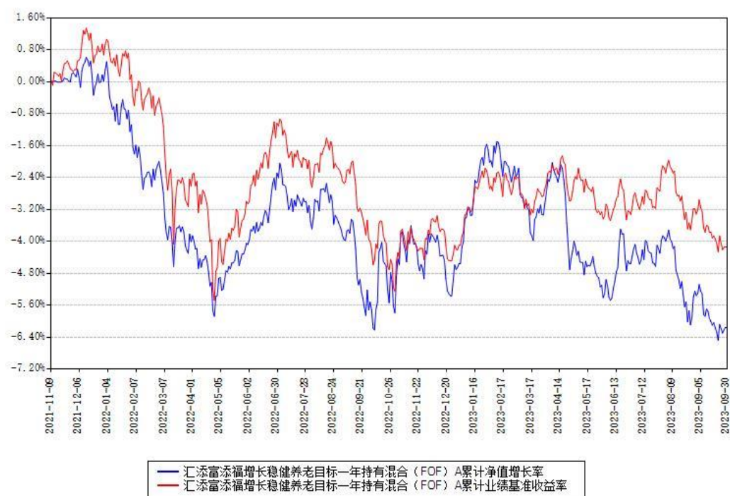
汇添富添福增长稳健养老目标一年持有混合（FOF）A累计净值增长率与同期业绩基准收益率对比图

（二）自基金合同生效以来基金累计净值增长率变动及其与同期业绩比较基准收益率变动的比较图